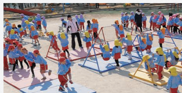
多彩な安田式サーキットの実践映像をご覧いただけます