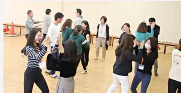
指導する楽しさ・指導される楽しさを体感します