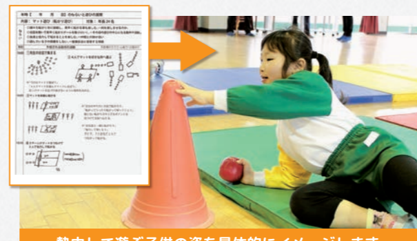
熱中して遊ぶ子供の姿を具体的にイメージします