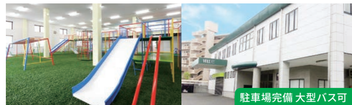
駐車場完備 大型バス可