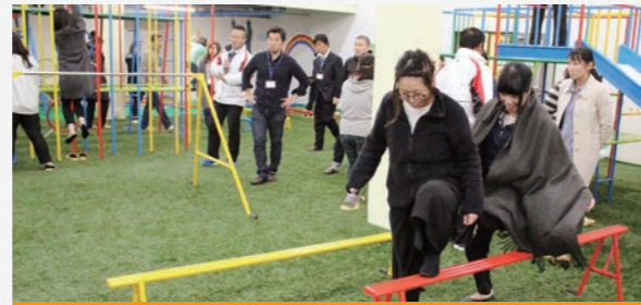
声かけや環境設定の工夫の仕方がポイントです